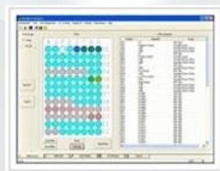
ChroMate® omogućuje slobodan izbor analiza.