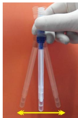
4. Mešanje 5 s brisa