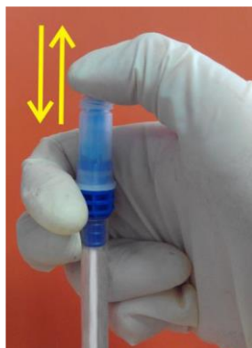
3. Aktivacija brisa