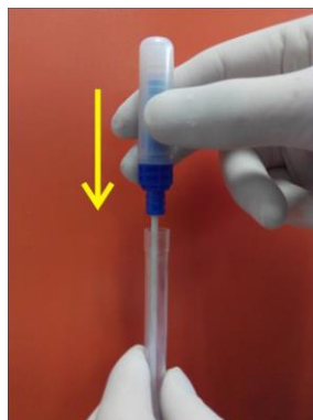
2. Vstavljanje brisa